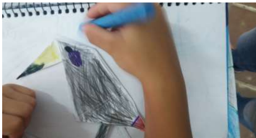
Figura 4 - Tucano feito pelas crianças do 1º ano