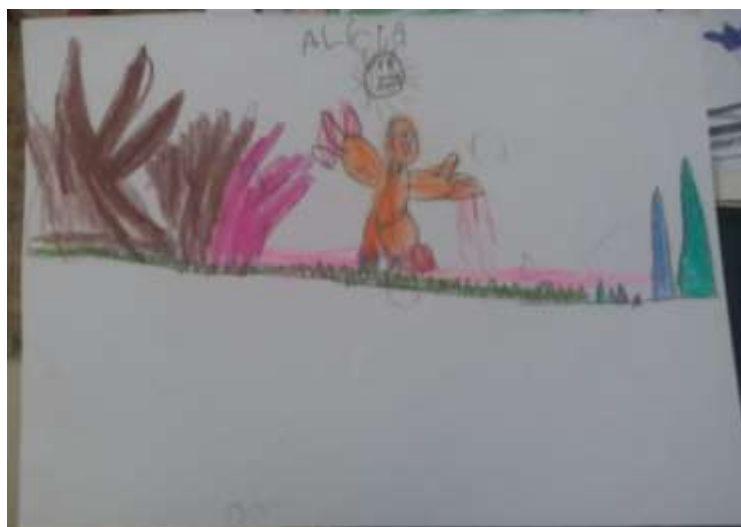
Figura 18 - Grúfalo 1º ano E