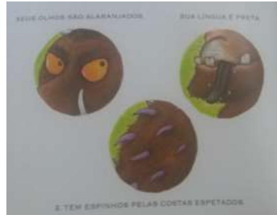
Figura 11 - Livro “O Grúfalo”, de Julia Donaldson