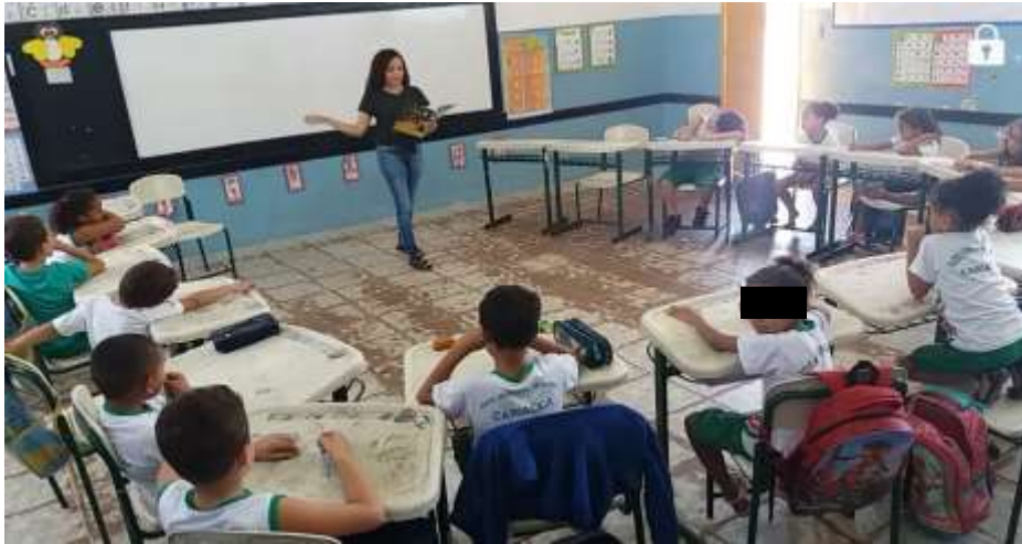
Figura 7 - Contação de Histórias 1º ano D