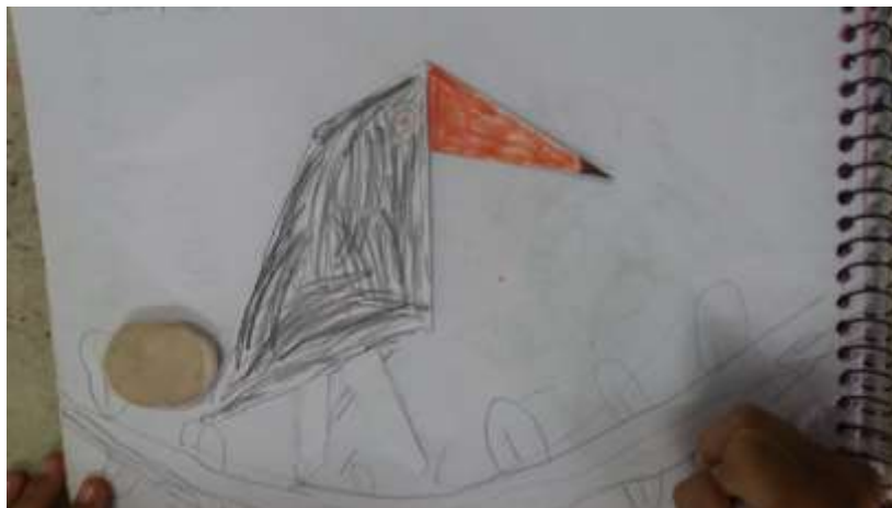
Figura 3 - Tucano feito pelas crianças do 1º ano