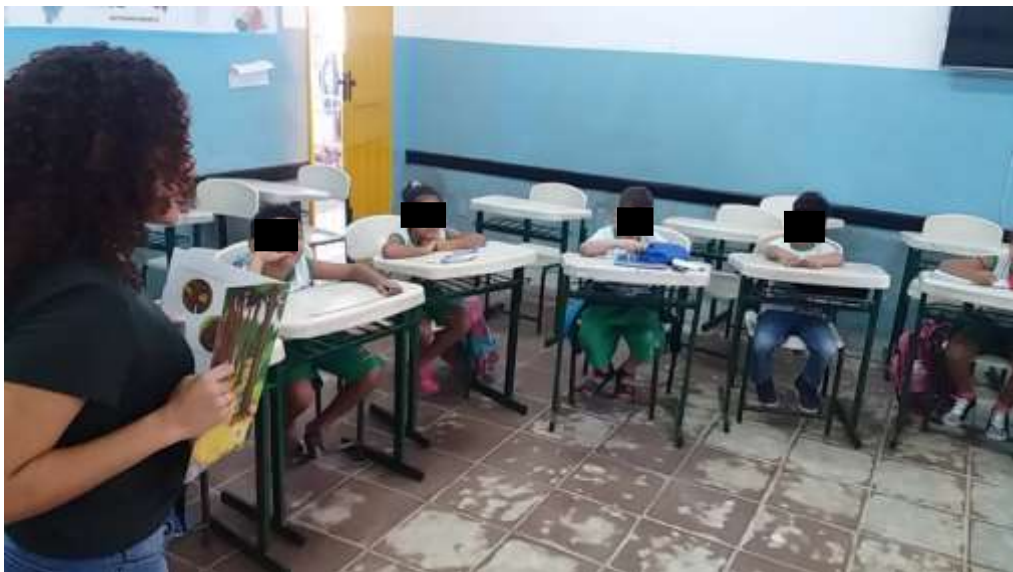
Figura 8 - Contação de Histórias 1º ano E