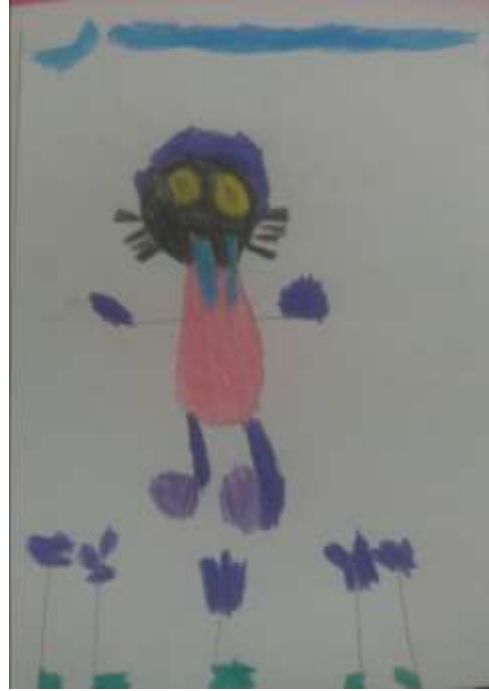
Figura 17 - Grúfalo 1º ano E