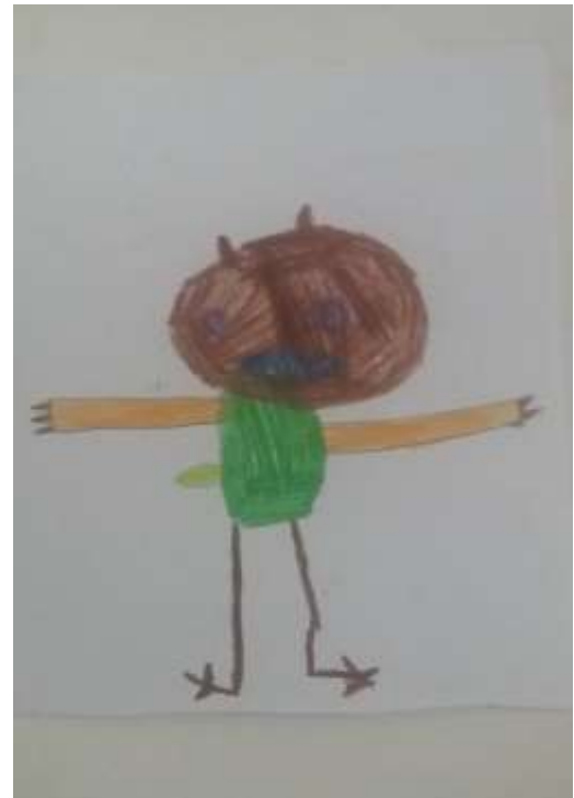
Figura 14 - Grúfalo 1º ano D