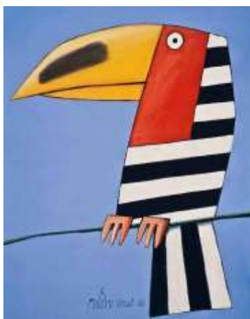
Figura 5 - Tucano amarelo, preto, branco e vermelho no galho (2006)

Nota-se que, pela falta de referências, todas as crianças fizeram cópias um dos outros e do trabalho sugerido pela professora. Compreende-se que se a professora trouxesse imagens de tucanos reais e mostrasse a diversidade de espécies, a atividade teria sido enriquecida e, possivelmente, resultaria em uma multiplicidade de trabalhos. Além disso, poderia trazer a poética de diferentes artistas ao retratar alguns animais, como por exemplo, os Tucanos de Gustavo Rosa (Figuras 5 e 6), refletindo com as crianças sobre as diferentes possibilidades de se expressar por meio das Artes Visuais.