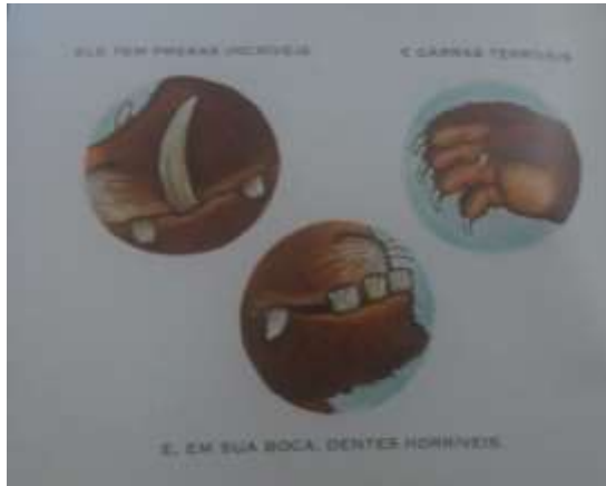
Figura 10 - Livro “O Grúfalo”, de Julia Donaldson