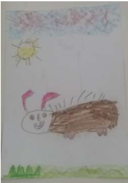
Figura 13 - Grúfalo 1º ano D

Nesse processo imaginativo e criativo, podemos destacar que o interessante da atividade, é que cada criança desenhou um personagem diferente e único, a partir de uma mesma narrativa. A seguir, pode-se observar os “Grúfalos” desenhados pela turma do 1º ano D (Figuras 13 e 14):