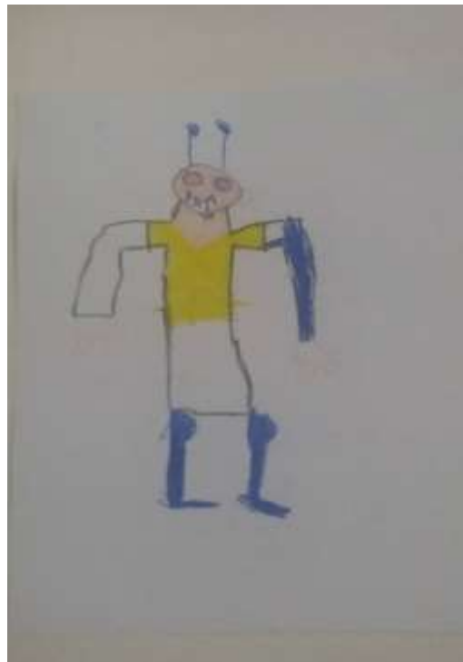
Figura 11 - Grúfalo 1º ano D

Na imagem abaixo (Figura 15), ainda temos um desenho feito por uma criança do 1º ano D, que mesmo após ouvir a narração da história do Grúfalo, e ele tendo sido representado como um ser assustador, esse aluno o desenhou vestindo uma camiseta e seu corpo com características de uma pessoa. A partir da análise desses desenhos é possível notar que o que é assustador para um, pode não ser para outro, pois cada grupo tem suas experiências, seus hábitos e comportamentos singulares.