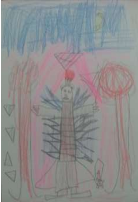
Figura 12 - Grúfalo 1º ano E