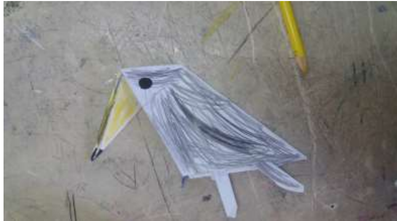
Figura 2 - Tucano feito pelas crianças do 1º ano