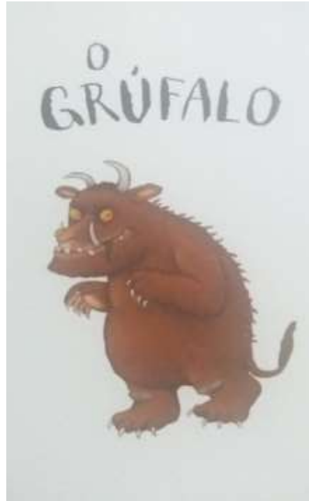
Figura 9 - Livro “O Grúfalo”, de Julia Donaldson