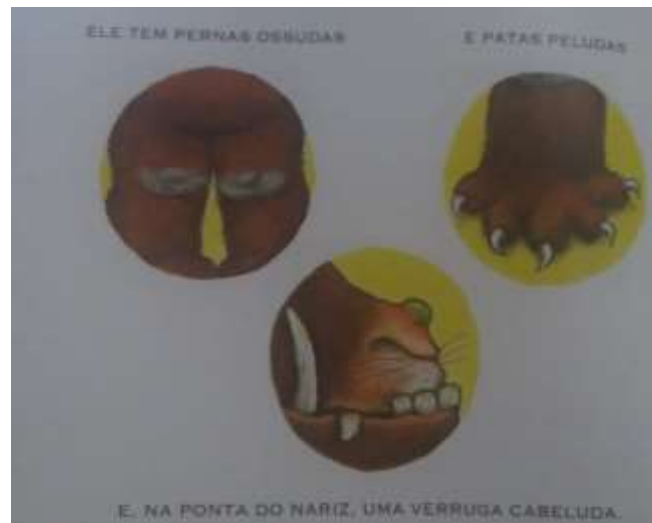
Figura 12 - Livro “O Grúfalo”, de Julia Donaldson