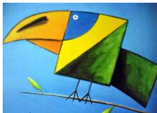
Figura 6 - Tucano (2006)